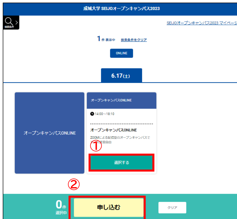
▲予約フォームTOP画面